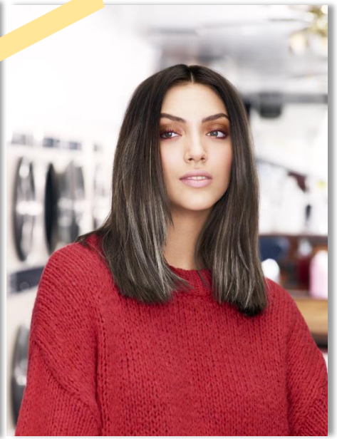
Uitgroei/ Witte Haren

Blondines die willen terugkeren naar hun natuurlijke/koele blonde haren