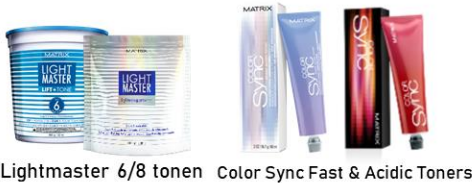
Lightmaster 6/8 tonen Color Sync Fast & Acidic Toners